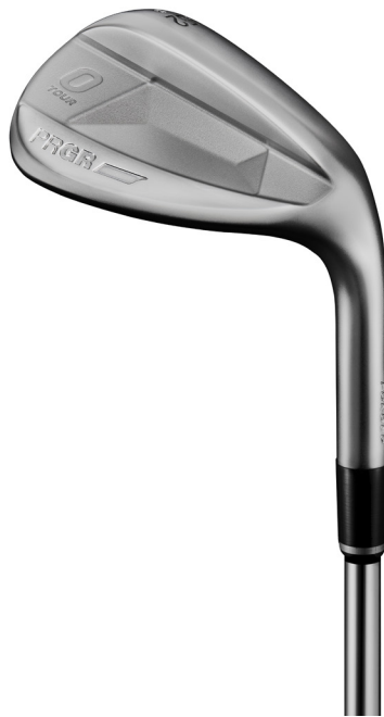
「PRGR 0 TOUR WEDGE」ノーマッキ仕様

なお、販売はPRGR直営店またはPRGRのフィッティングイベント、販売店とのタイアップ試打会および全国でおよそ90店舗のPRGRフィッティングマイスターショップのみで、お客様のオーダーに沿った仕様で一から組み立てるカスタムオーダー専用モデルとなります。